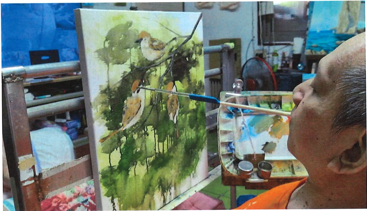
花蓮部落身心障礙者繪畫課程《揮灑畫布人生》：